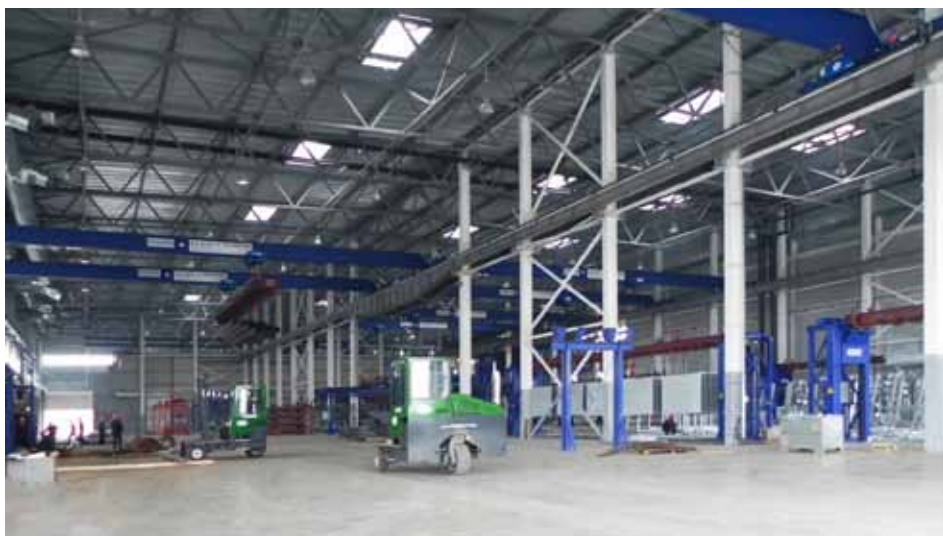
Участок съема-навески нового цеха цинкования

4 февраля 2013 стало важной датой в истории ООО «Точинвест-Цинк». В этот день на дочернем предприятии группы компаний «Точинвест» состоялся пуск второго цеха горячего цинкования металлоконструкций.