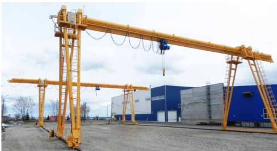
Новая крановая площадка

Поставщиком современного автоматизированного технологического оборудования снова выступила компания KOERNER – один из лидеров мирового рынка в выпуске производственных линий для горячего цинкования. Под контролем экспертов фирмы KOERNER был осуществлен монтаж оборудования, произведены пусконаладочные работы. Ведущие специалисты ООО «Точинвест-Цинк», у которых к тому моменту уже был накоплен немалый опыт