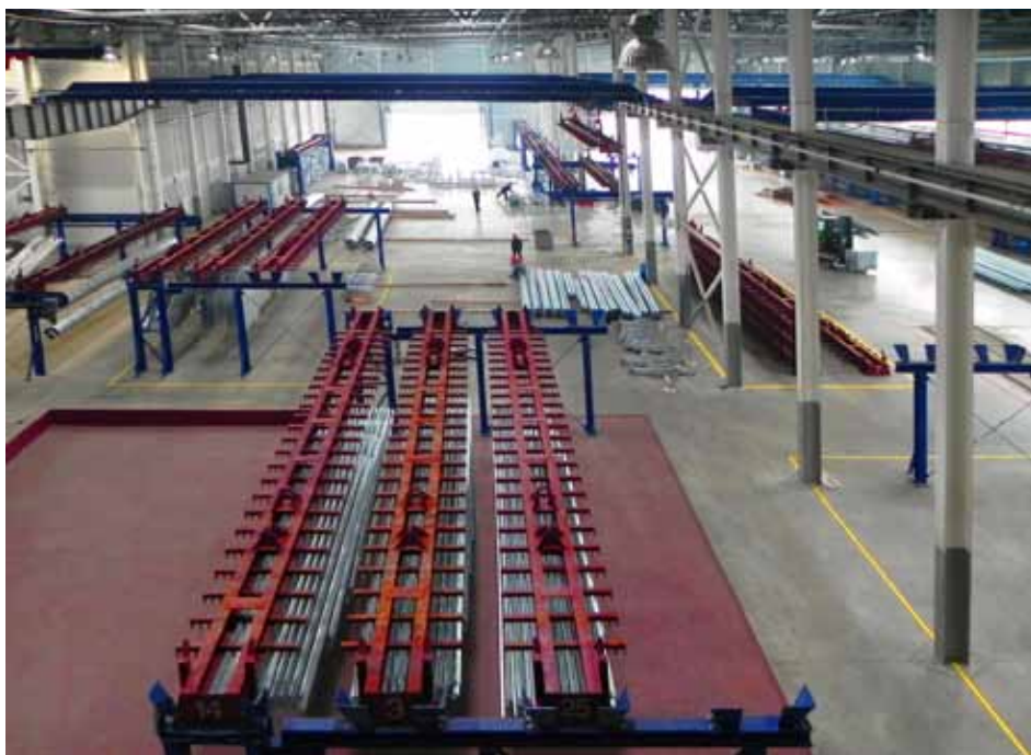
Новый цех горячего цинкования

в своей профессии, прошли необходимую подготовку для работы на новой, полностью автоматизированной линии.